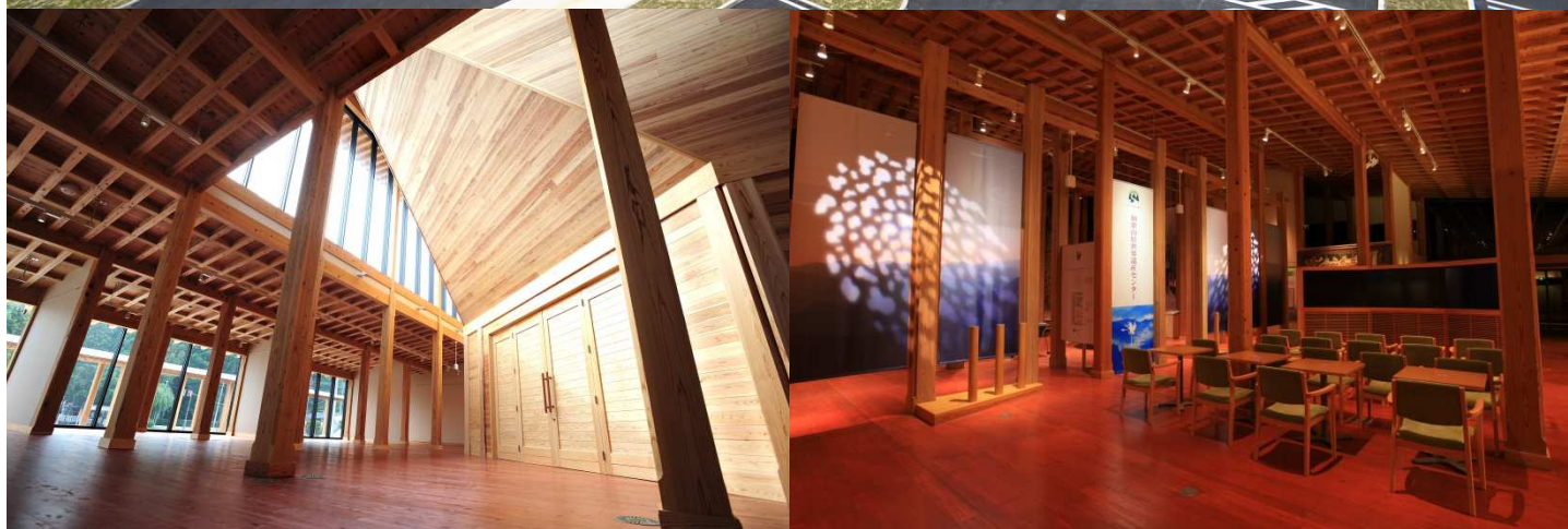
田辺市本宮町 和歌山県世界遺産センター